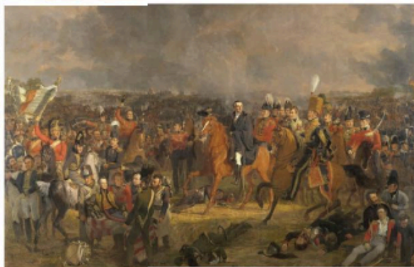
De slag bij Waterloo, Jan Willem Pieneman, 1824.