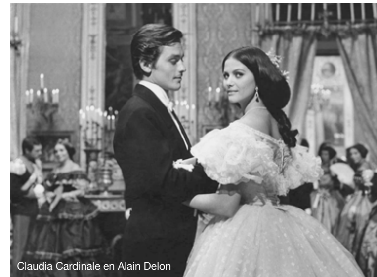
Claudia Cardinale en Alain Delon