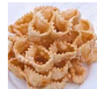
Origliette, een Sardijnse pastaspecialiteit

Onderweg vergapen we ons aan de schitterende vergezichten. Regelmatig stoppen we voor overstekende koeien die op hun dooie gemakje over de weg wandelen, we ruiken aan de kleurige bloemen langs de kant. Cala Gonone zelf voelt echter een beetje als vergane glorie, al maakt een ijsje van Gelateria Fancello een hoop goed.