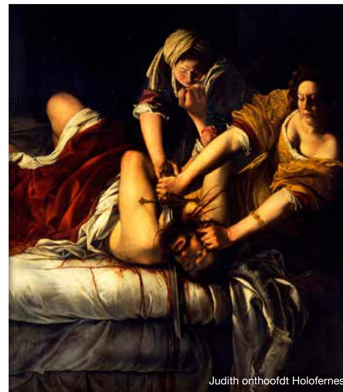
Judith onthoofdt Holofernes

De tentoonstelling De dames van de barok in MSK Gent toont dat Artemisia Gentileschi niet de enige tegendraadse artistiekeling van haar tijd was. De bezoeker wordt meegenomen naar een bijzonder moment in de kunstgeschiedenis waarop de vrouwelijke kunstenaar een prominenter plaats begint in te nemen. De dames van de barok, t/m 20 januari 2019 mskgent.be