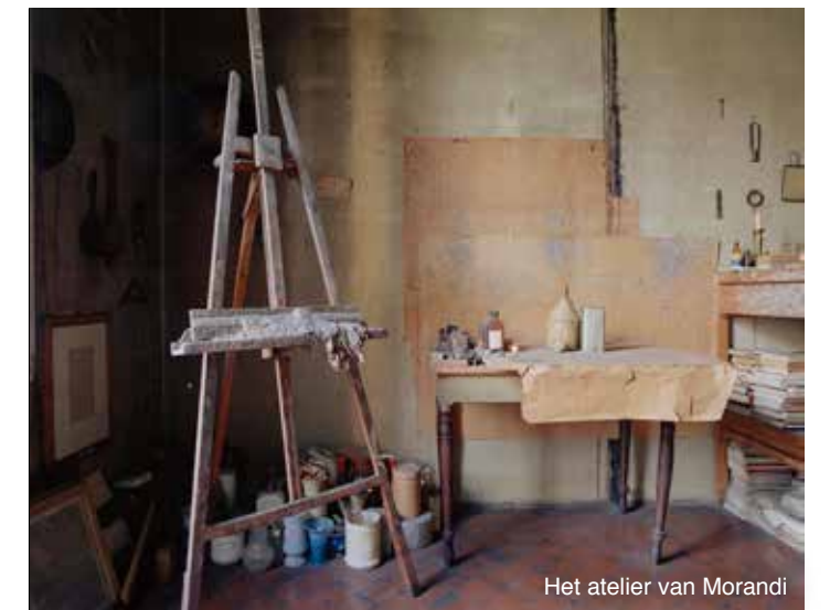
Het atelier van Morandi