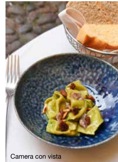
Camera con vista

Op zaterdagochtend vind je voor Cinema Lumière, een bioscoop waar klassiekers worden getoond en interessante lezingen worden gehouden, Mercato Ritrovato – een markt met mooie kazen en streekproducten. Via Azzo Gardino 65