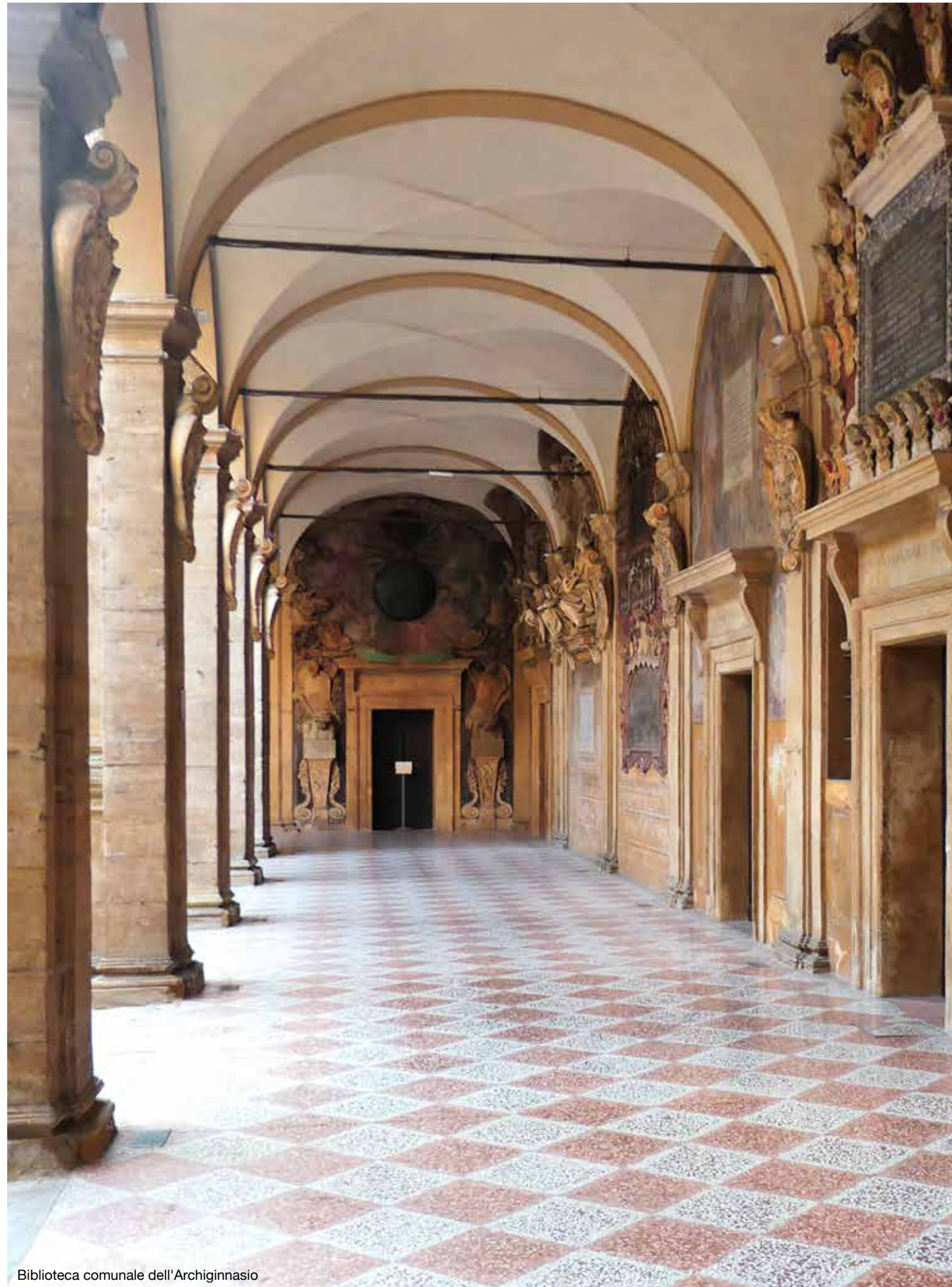
Biblioteca comunale dell'Archiginnasio